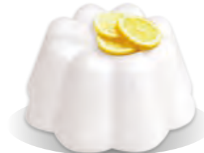
PUDING CITRÓN Liana