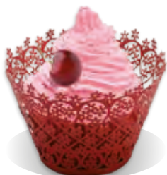
STUŽOVAČ Liana VIŠŇA