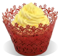
STUŽOVAČ Liana VANILKA

Výhodné gastro balenie nielen pre reštaurácie, vývarovne, pekárne či firmy, ktoré uprednostia jeho výhodnejšiu cenu. So stužovačom šľahačky si viete veľmi rýchlo pripraviť chutné plnky do Vašich zákuskov a tort. Stačí iba rozmiešať stužovač vo vode, alebo mlieku a zamiešať do dobre vyšľahanej šľahačky a plnka je hotová.