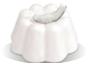
PUDING KOKOS Liana