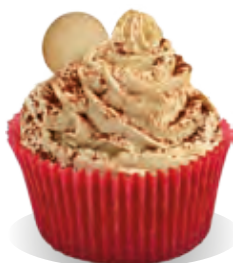
Stužovňač Liana TIRAMISU