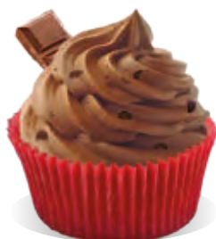
Stužovač Liana ČOKOLÁDA