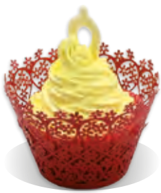
STUŽOVAČ Liana VAJEČNÝ LIKÉR