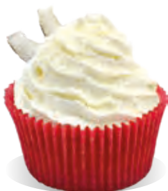
Stužovňač Liana KOKOS