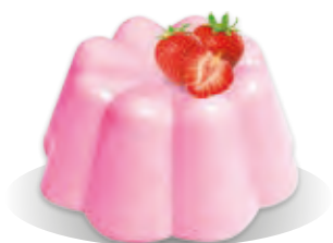
PUDING JAHODA Liana