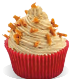
Stužovňač Liana TOFFEE