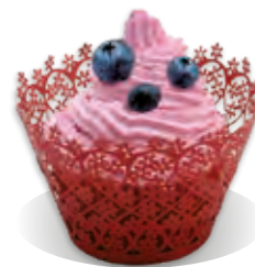
STUŽOVAČ Liana ČUČORIEDKA