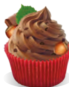
Stužovač Liana LIESKOVÝ ORECH - ČOKOLÁDA