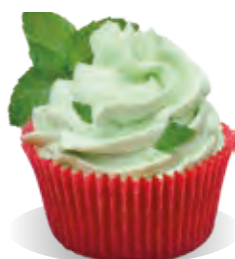
Stužovač Liana SVIEŽA MÁTA