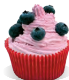
Stužovač Liana ČUČORIEDKA