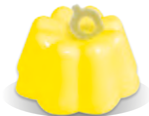
PUDING VAJEČNÝ LIKÉR Liana