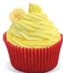
Stužovňač Liana BANÁN