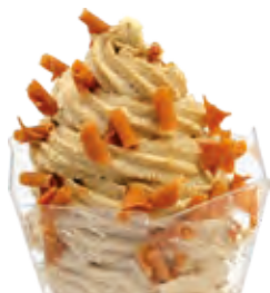
STUŽOVAČ Liana TOFFEE