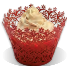
STUŽOVAČ Liana TIRAMISU