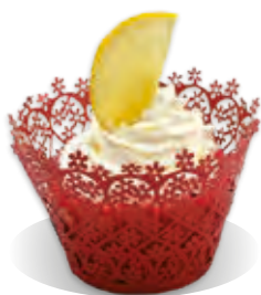
STUŽOVAČ Liana CITRÓN