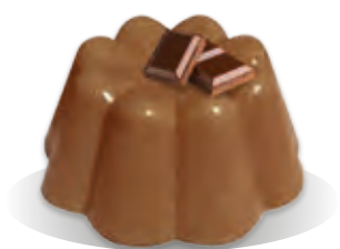
PUDING TMAVÁ ČOKOLÁDA Liana