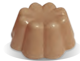
PUDING KAKAOVÝ Liana