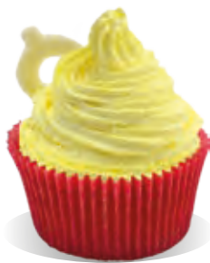
Stužovač Liana VAJEČNÝ LIKÉR