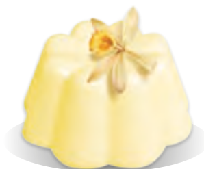
PUDING VANILKA Liana