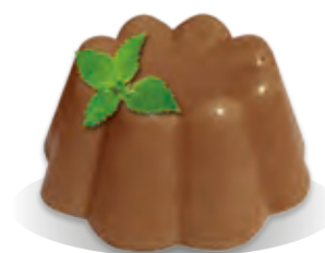
PUDING ČOKO - MINT Liana