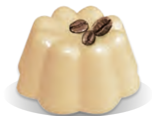
PUDING KÁVA Liana