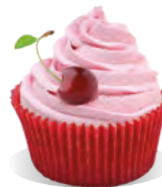
Stužovňač Liana VIŠŇA