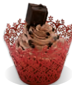
STUŽOVAČ Liana ČOKOLÁDA