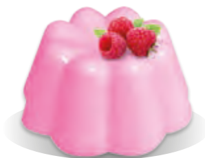
PUDING MALINA Liana