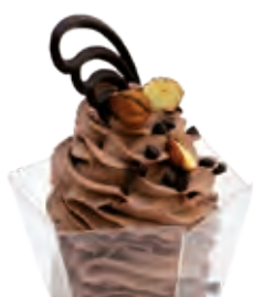
STUŽOVAČ Liana ORIEŠKOVO - ČOKOLÁDOVÝ