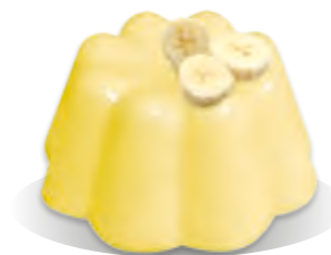
PUDING BANÁN Liana