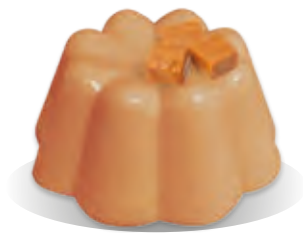
PUDING TOFFEE Liana