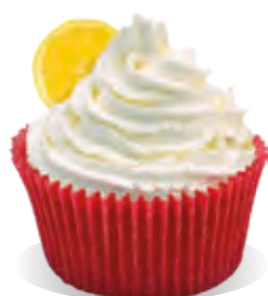
Stužovač Liana CITRÓN

Stužovače šľahačky Liana pre exkluzívne dezerty, zmrzliny, zákusky a torty s nezameniteľnou chuťou. So stužovačmi Liana vytvoríte exkluzívny candy bar na rôzne príležitosti. Pre ešte zaujímavejšie variácie môžete k plnkám pridať aj rôzne druhy čerstvého, mrazeného alebo zaváraného ovocia.